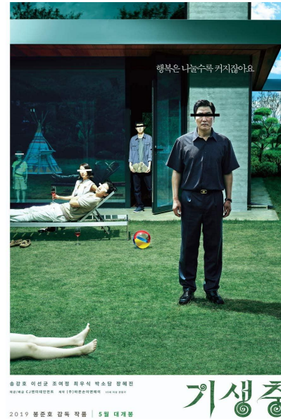
Television & Film TV 및 영화